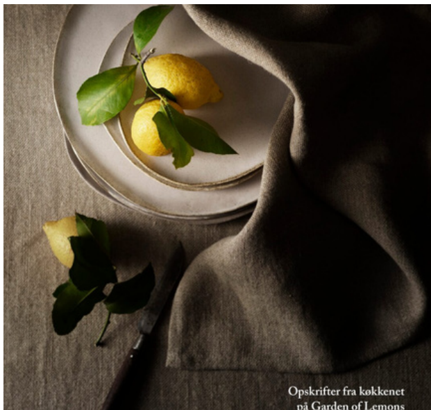
Opskrifter fra køkkenet på Garden of Lemons